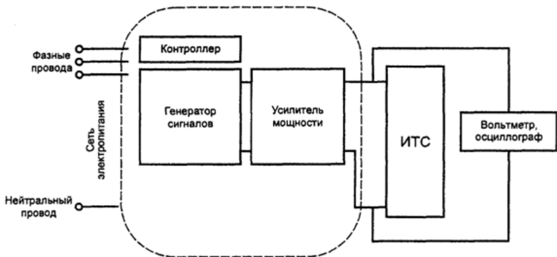
Рисунок 3. Схема испытательного оборудования с усилителем мощности

Схема оборудования для испытаний ТС на устойчивость к изменениям частоты питающего напряжения с использованием ИГ, состоящего из генератора сигналов и усилителя мощности приведена на рисунке 3.