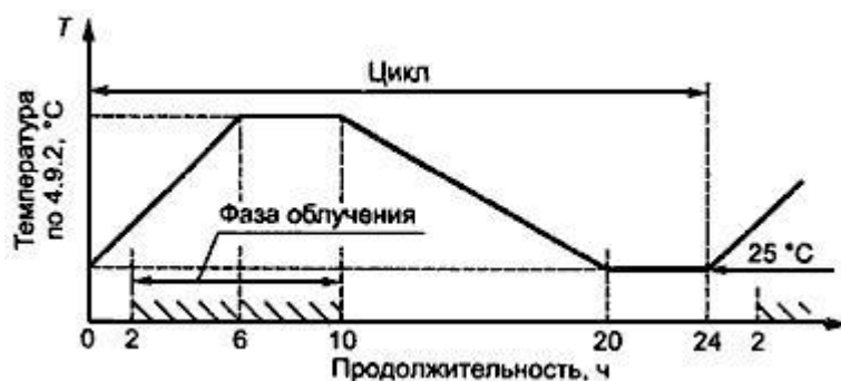
Рисунок 4 - Методы 211-4.1