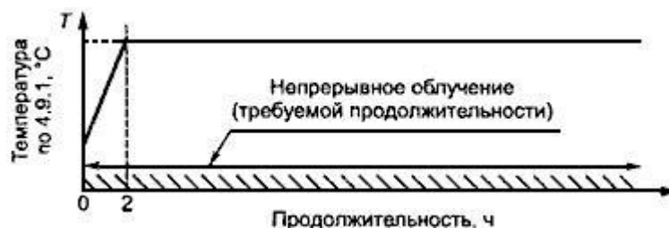
Рисунок 1 - Метод 211-1