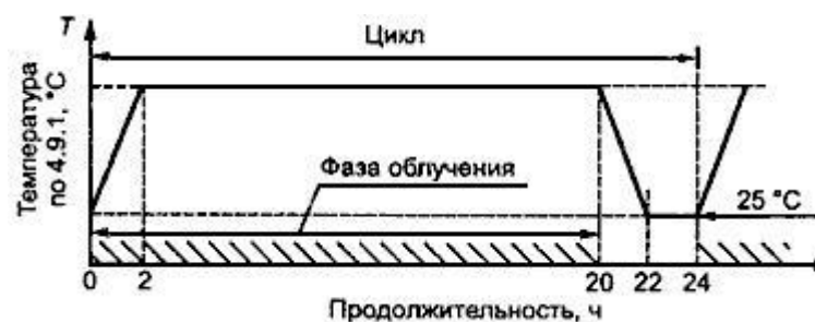
Рисунок 3 - Метод 211-3